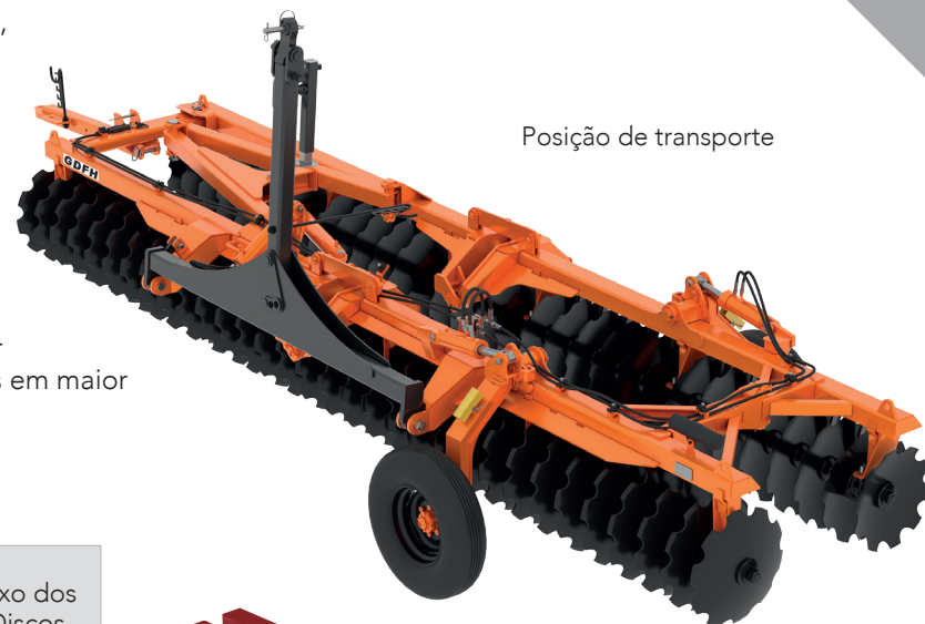
Posição de transporte

• Possui sistema de transporte longitudinal com pneus acionados por pistões hidráulicos, o que permite colocar rapidamente a grade em posição de transporte, possibilitando transitar por lugares estreitos e longas distâncias em maior velocidade.