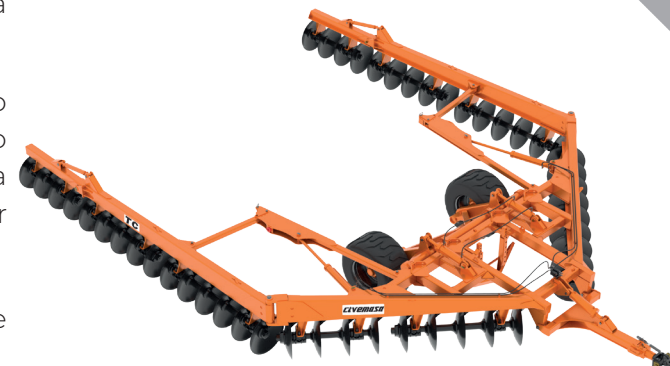
TC² 48: Posição de Transporte

Os conjuntos de discos são equipados com mancais de rolamentos com lubrificação permanente a óleo. Estes mancais possuem uma capa protetora em sua parte inferior, com a função de evitar o desgaste do seu corpo.